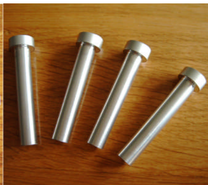
Alu Stiften variant B